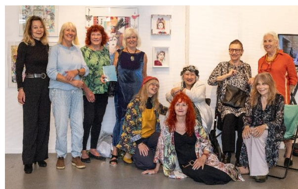
Een van de nieuwe klassenfoto's van De klas van 69