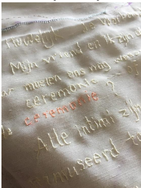
afbeelding: Het Huwelijk-de Voorbereiding (detail)

Van 1 tot en met 26 februari is werk van mij te zien in de expositie Entree, werk van nieuwe leden, in de Haagse Kunstkring.