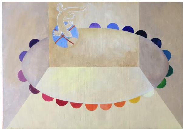
afbeelding: Kleurentafel – olieverf op doek

De expositie Mythen en Dromen in Veere is nog één week te zien in de 'Zeemanskamer'. De finissage zal op 22 januari plaats vinden met een presentatie woordmuziek van Annemarie van Es.