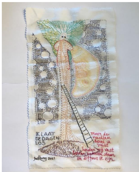
Spirit Tree: Ik laat de dagen los. - borduurwerk Stadscollectie Textiel

Nieuwsbrief - Sonja van der Burg – nr.33: 1 november 2022