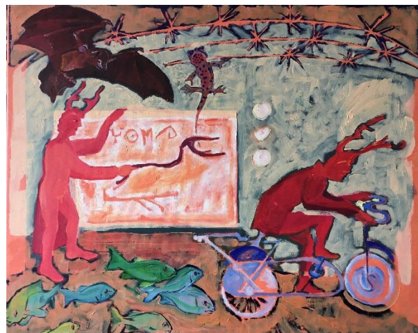
afbeelding: Gestuurd – olieverf op doek